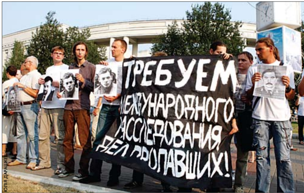
200 чалавек у Мінску патрабавалі расследавання фактаў, прыведзеных у фільмах «Хросны бацька». Пікет адбыўся 16 жніўня каля Акадэміі навук.