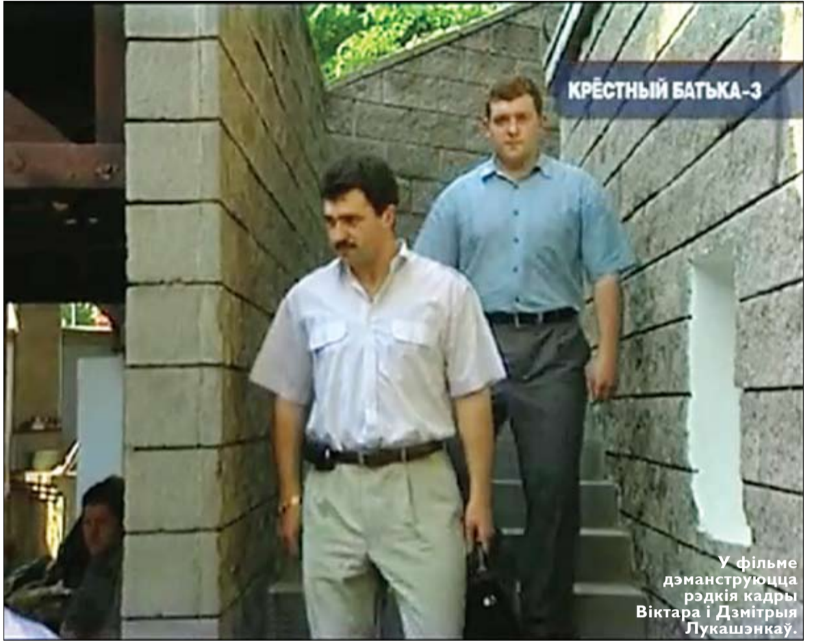
У фільме дэманструюцца рэдкія кадры Віктара і Дзмітрыя Лукашэнкі.

«НН»: Дык, можа, трэба было гэты фільм паказаць, калі нічога страшнага ў ім няма?