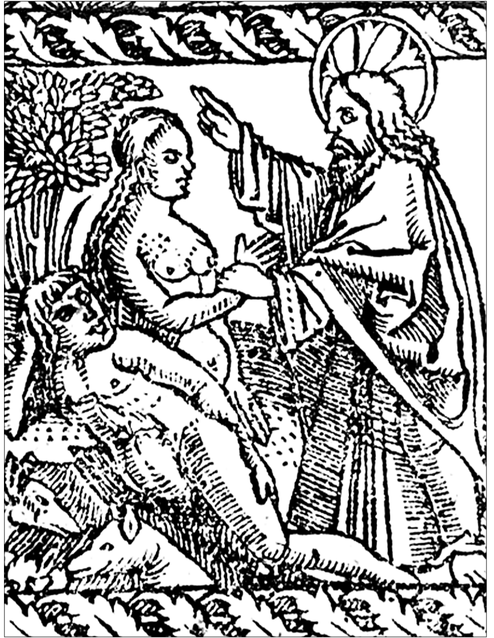
Гравюра Скарынавай «Бібліі» (1519).

адно: калі муж быў супраць пакарання. Калі ж падчас пагоні выкрадалінік забіваў мужа, то ён разглядаўся судом як гвалтоўнік супраць шляхецкага дому і караўся смерцю.