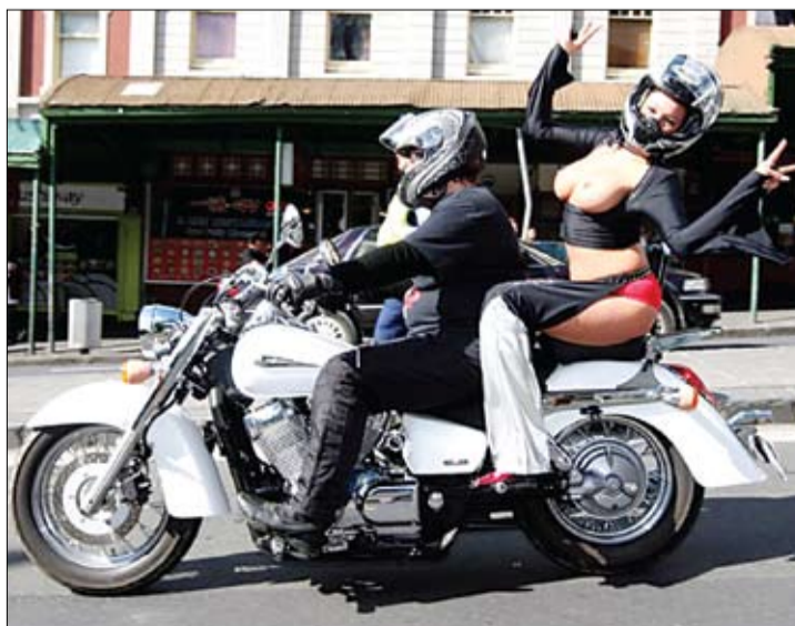
Байкеры зладзілі ў Новай Зеландыі парад бюстаў. Здавалася б, прычым тут матацыклы?