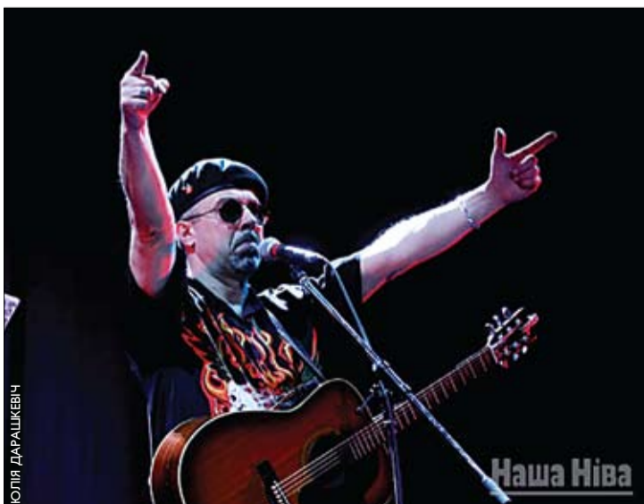
15 жніўня рок-каралю і лідэру гурта «Крама» Ігару Варашкевічу споўнілася 50 гадоў.