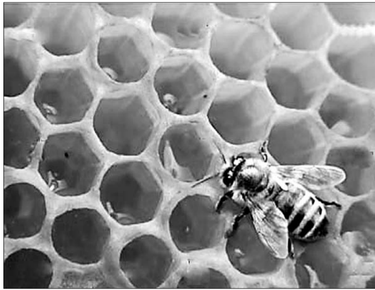
Як выбраць якасны мёд?

Ля іх гандлююць «свежымі тулскімі пернікамі», да якіх пакупнікі ставяцца насцярожана — спалучэнне слоў «тульскія» і «свежыя» прымушае іх задавацца пытаннем: «А дзе тая Тула знаходзіцца?» Хаця, зразумела, што