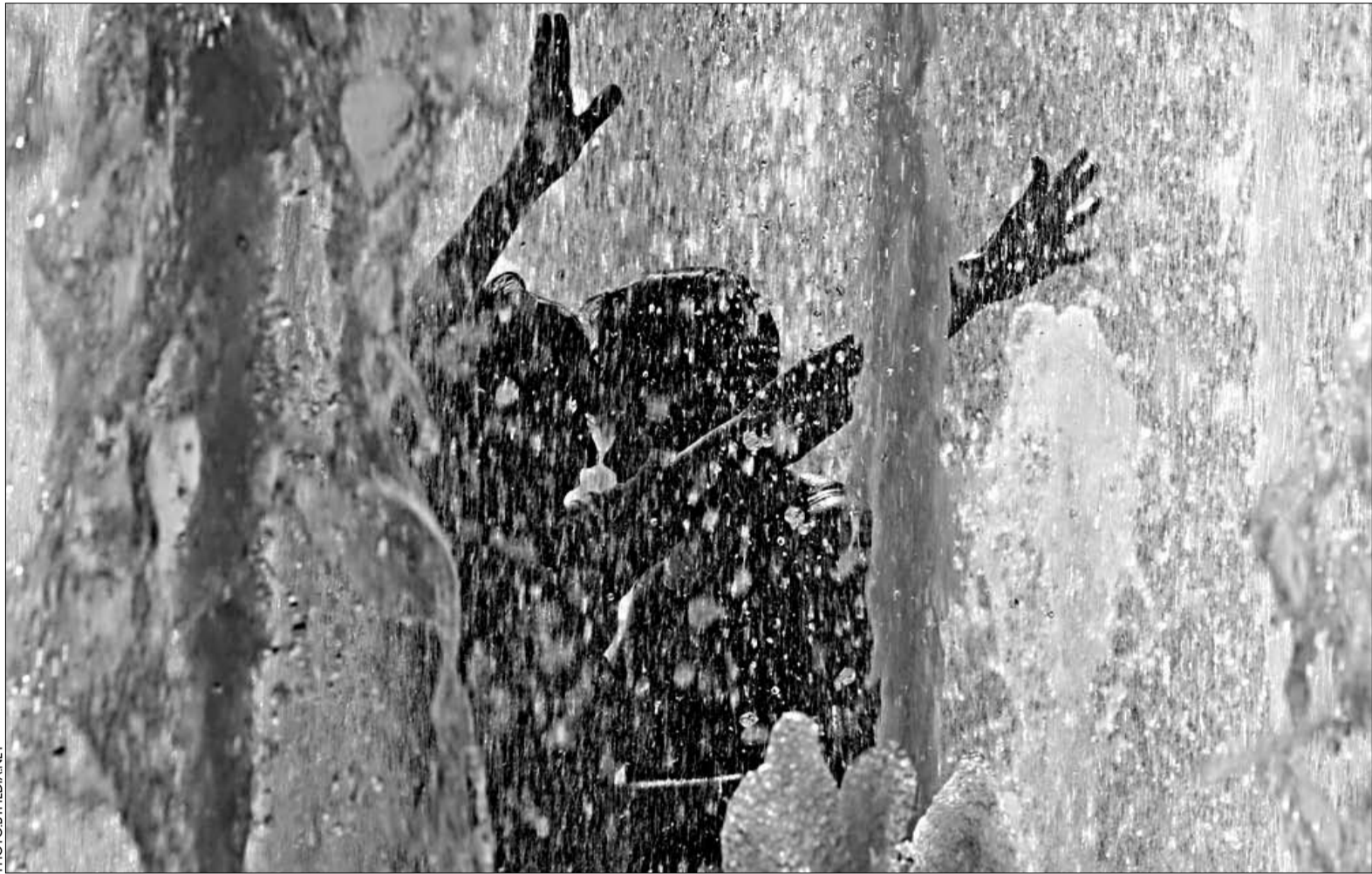
Гэтым летам можна прызначыць спатканне ў фантане. Такое дакладна запомніцца.

Прыгадайце (хаця б намёкам) пра вашы каштоўнасці, пра вашы чаканні ад сувязі — у большасці выпадкаў вас зразумеюць. Памятайце, гутарка —