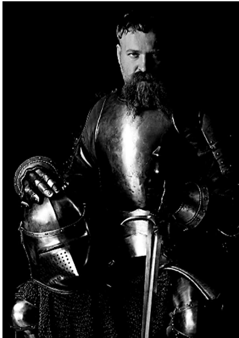
Вітаўт Вялікі. Рэканструкцыя фотамастака Алега Белавусава .